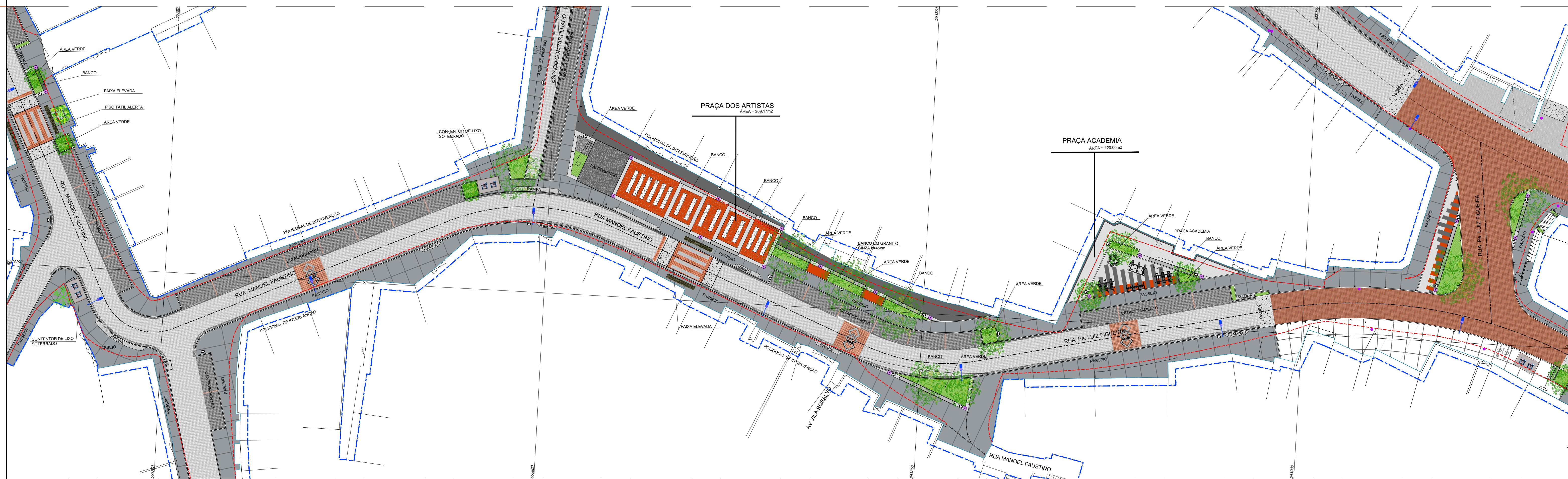
PROJETO BÁSICO URBANÍSTICO - TRECHO 08 ESC: 1:250